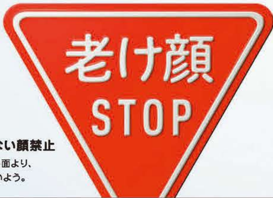
元気ない顔禁止 しかめっ面より、 笑顔でいよう。