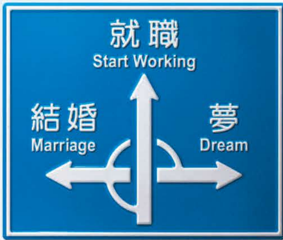
若者の生き方いろいろ 価値観を押し付けずに応援しよう。