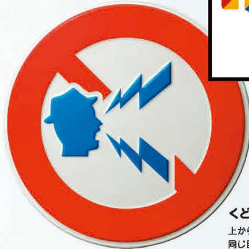
くどくど禁止 上から目線で言わず、 同じ目線で話そう。