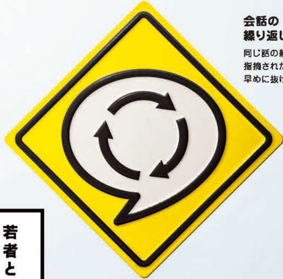
会話の 繰り返し注意 同じ話の繰り返し注意、 指摘されたら 早めに抜けよう。

若者とのコミュニケーション線を合わせて温もり込めて。 — 平均年齢66歳・松江市 山陰中央新報文化センター松江教室「やさしい水彩画講座」の生徒さん。世代の離れた若者とコミュニケーションするにあたって、気をつけていることをお聞きしました。「娘や息子の将来について、気になったとしても、本人のやりたいことを応援するのが大切だと思う」「メールは無表情に感じるので、絵文字を使ったり、電話したりと、気持ちが伝わるように気をつけている」「自慢話はせず、その場の共通話題を探して皆が楽しめるように」「気持ちはずっと現役で」といった、多種多様なことを心がけている皆さん。学びの多い時間となりました。 今日は、そんなルールを交通標識になぞらえて表現してみました。ぜひ参考にしてみてくださいね。