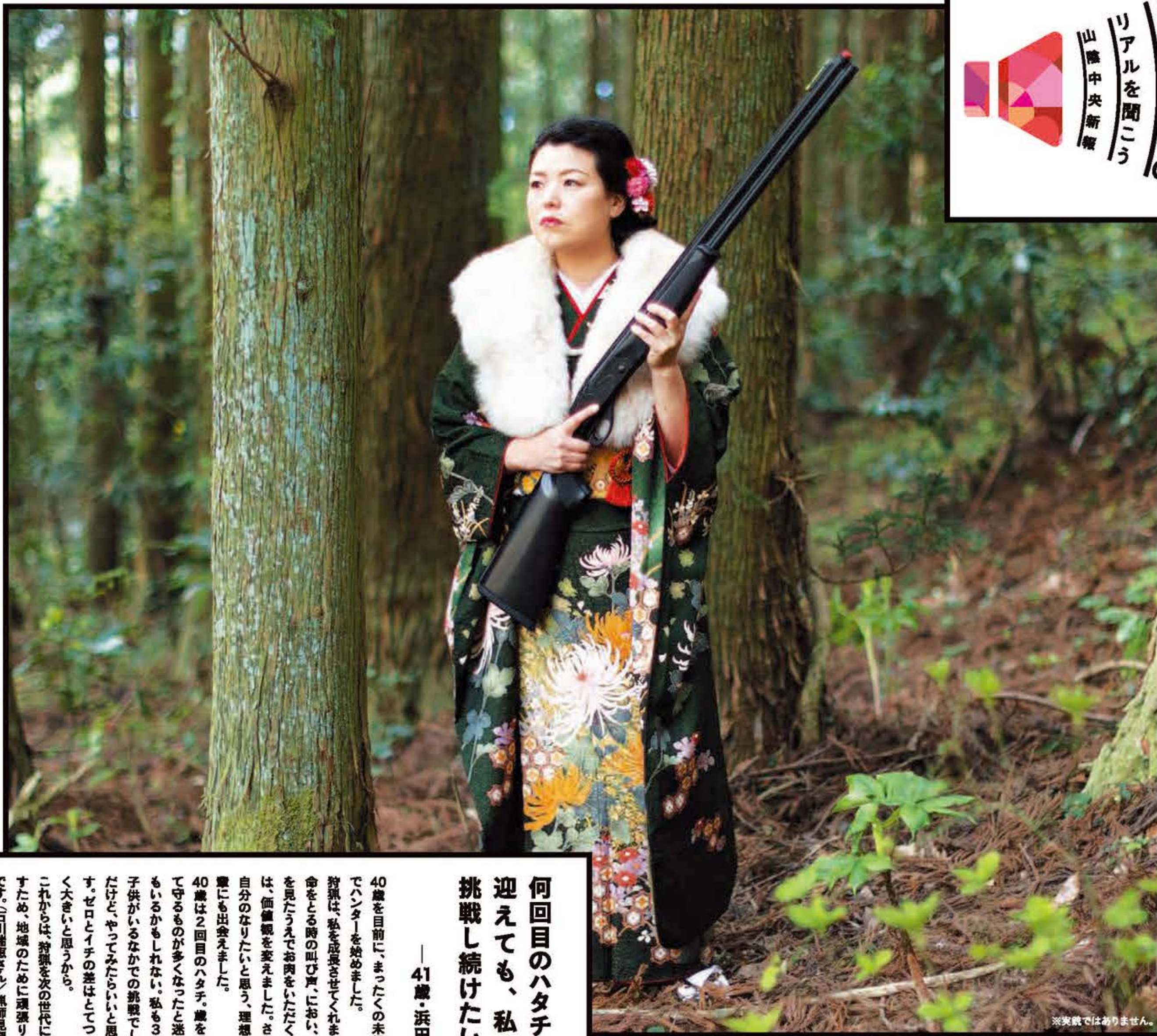
※実銃ではありません。